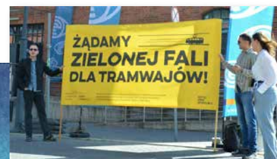
rys. Paweł Kuczyński

instytutsprawobywatelskich.pl/co-robimy/tiry-na-tory